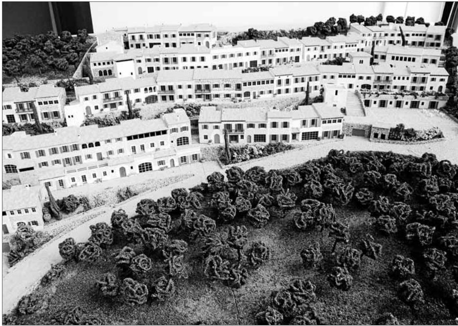
Maqueta de la urbanització projectada, en vigor si s'aixeca la protecció decretada fa dos anys.

La secció de Submarinisme i Protecció Civil, juntament amb les vocalies de Pesca i Piragüisme del Club Nàutic de Sóller i amb la col·laboració de moltes altres institucions i organismes han organitzat per demà diumenge una neteja submarina de la badia per tal de promoure la petició de la reserva de S'Illeta. els participants es trobaran a les davant del Moll de l'hotel Miramar i després berenaran convidats per l'Associació d'Hotelers. En acabar la tasca també participaran en un dinar ofert per la mateixa associació.