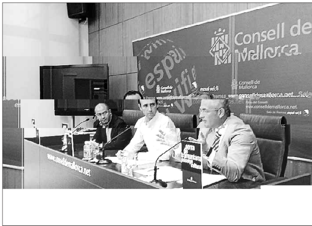
El PP es compromet a reduir la urbanització

Si això passa, el PP ja ha anunciat que, en lloc de la macrourbanització, hi proposarà una reducció considerable. De les 5,5 hectàrees urbanitzables es passaria a 3,3, no es permetria fer-hi plurifamiliars i just s'hi autoritzarien 27 unifamiliars per a 81 habitants més. El